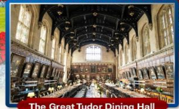
The Great Tudor Dining Hall

พิเศษ!! เมนูเบอร์เกอร์ต้นตำรับ & กุ้งล็อบสเตอร์ และ เปิดย่างไฟร์ชิลล์