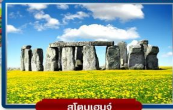
สโตนเฮนจ์