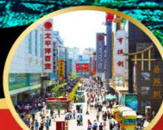
ถนนชุนชี่

-เมนูพิเศษ สุกิหม่าล่าเสฉวน , เปิดบักกิ้ง