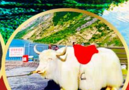
ทะเลสาปเต๋ยซี