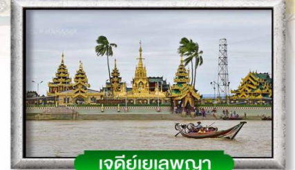
เจดีย์เลพญา