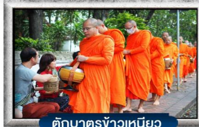
ตักบาตรข้าวเหนียว