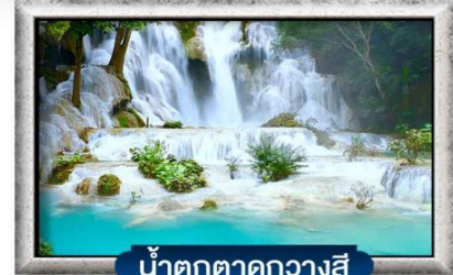
น้ำตกตาดควางสี