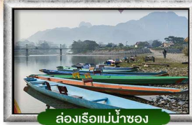
ล่องเรือแม่น้ำซอง