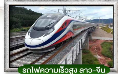
รถไฟความเร็วสูง ลาว-จีน