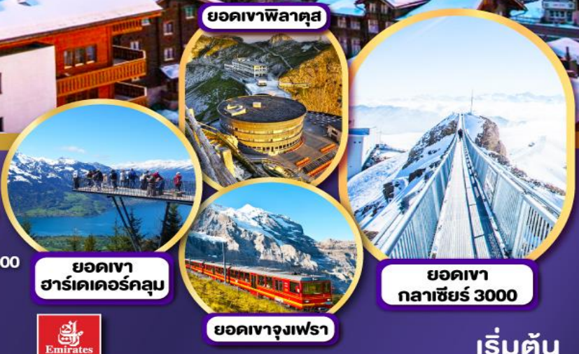
ยอดเขา ฮาร์เดอร์คูลม