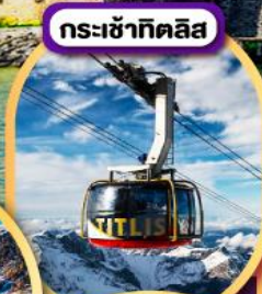
กระเช้าทิตลิส