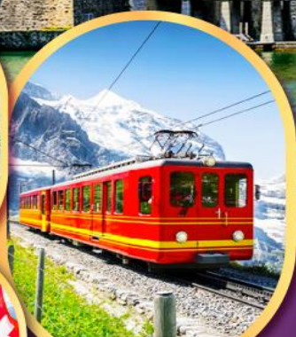
รถไฟสู่ ยอดเขาจุงเฟรา

15-22 ต.ค.67 13-20 พ.ย.67 04-11 ธ.ค.67 26 ธ.ค.-2 ม.ค.68