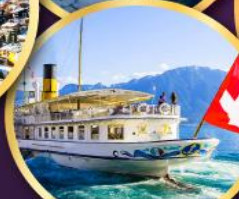
ล่องเรือ ทะเลสาบเจนีวา