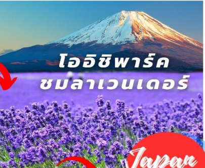
โออิชิพาร์ค ชมลาเวนเดอร์