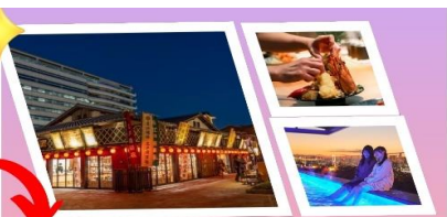
จุดเช็คอินใหม่ TOYOSU SENKYAKU BANRAI