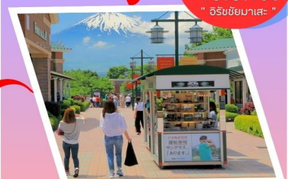
โกเทมบะ เอาท์เลท