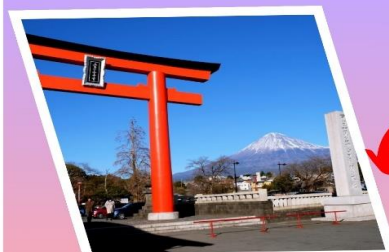
ศาลเจ้าฟูจิเซ็นเก็น