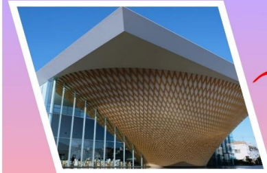
พิพิธภัณฑ์ ฟุจิกลับหัว