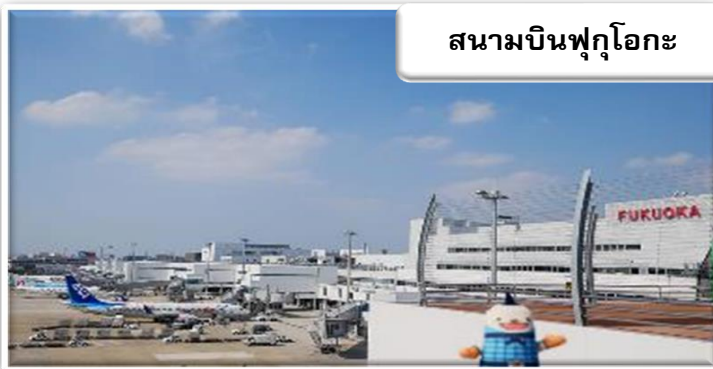
สนามบินฟุกุโอกะ

เวลา 01.45 น. ออกเดินทางสู่ สนามบินฟุกุโอกะ ประเทศญี่ปุ่น โดยสายการบินไทยแอร์เอเชีย เที่ยวบินที่ FD 236