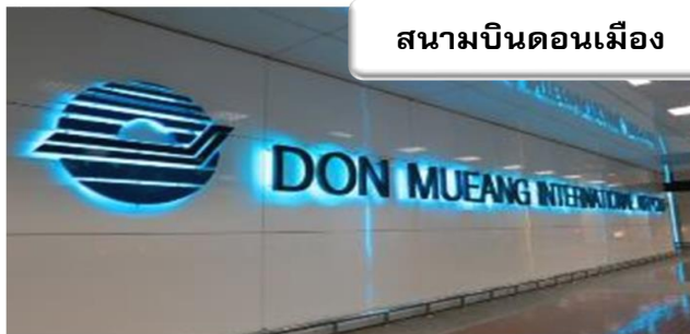
สนามบินดอนเมือง

เวลา 22.30 น. พร้อมกันที่ ท่าอากาศยานดอนเมือง อาคารผู้โดยสารขาออกระหว่างประเทศ เคาน์เตอร์สายการบินไทยแอร์เอเชีย เจ้าหน้าที่คอยให้การต้อนรับดูแลด้านเอกสาร เช็คอิน และสัมภาระในการเดินทาง