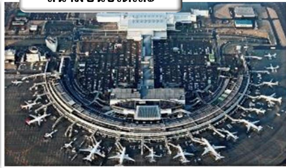
สนามบินชิตเสะ

เวลา 23.50 น. ออกเดินทางสู่ สนามบินชิตเสะ ประเทศ ญี่ปุ่น โดย สายการบินไทย เที่ยวบินที่ TG 670