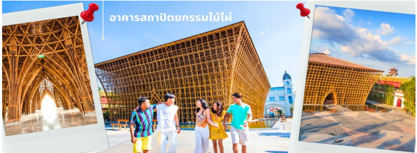
อาคารสถาปัตยกรรมไม้ไผ่

CVZP1 เกาะภูเก็ต-สวนสนุก Vin Wonders-อควาเรียมรูปเต่า-นั่งกระเช้า 3 วัน 2 คืน บิน VZ (Nov24-Mar25)