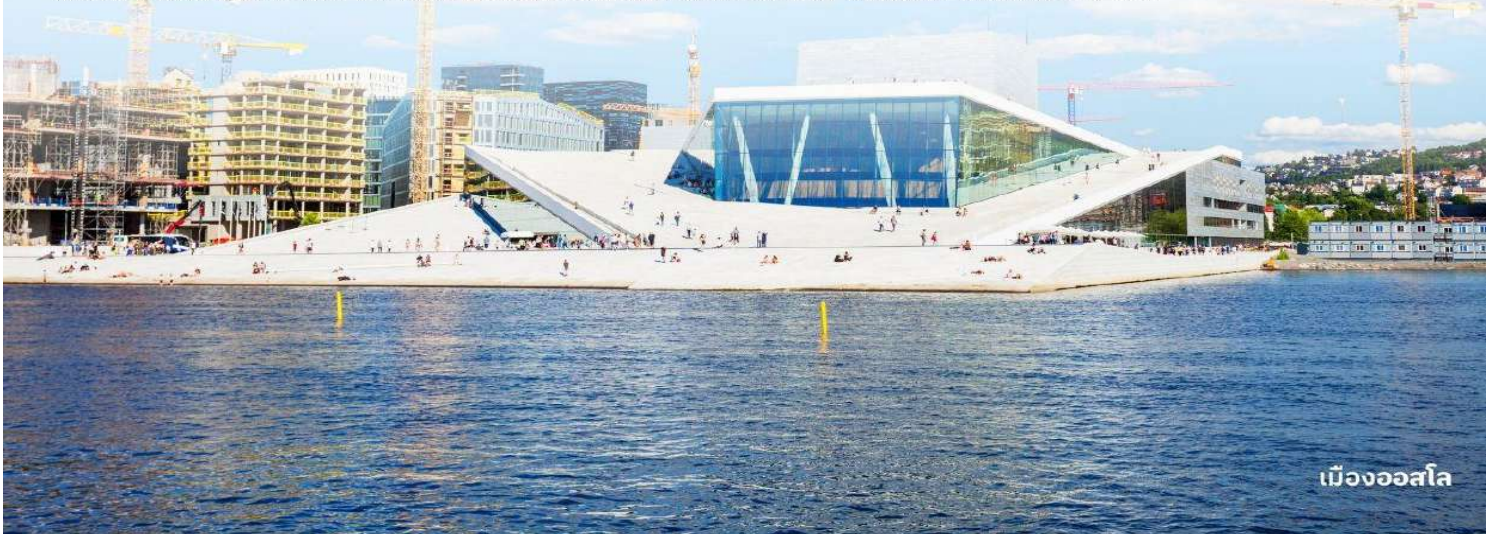
เมืองออสโล

นำท่านถ่ายรูป Operahuset ในออสโล (Oslo Opera House) เป็นสถาปัตยกรรมที่มีความเป็นเอกลักษณ์อย่างมาก สร้างบนพื้นที่แหลมที่สวยงามของกรุงออสโล ทุกท่านจะได้ประสบการณ์ที่สะท้อนถึงความงดงามของการเชื่อมต่อระหว่างศิลปะและธรรมชาติได้อย่างไม่มีขีดจำกัด