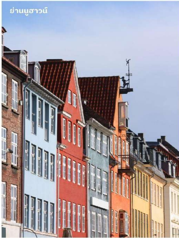
ย่านนูฮาวน์