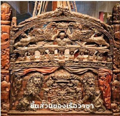
ชิ้นส่วนของเรือวาซา