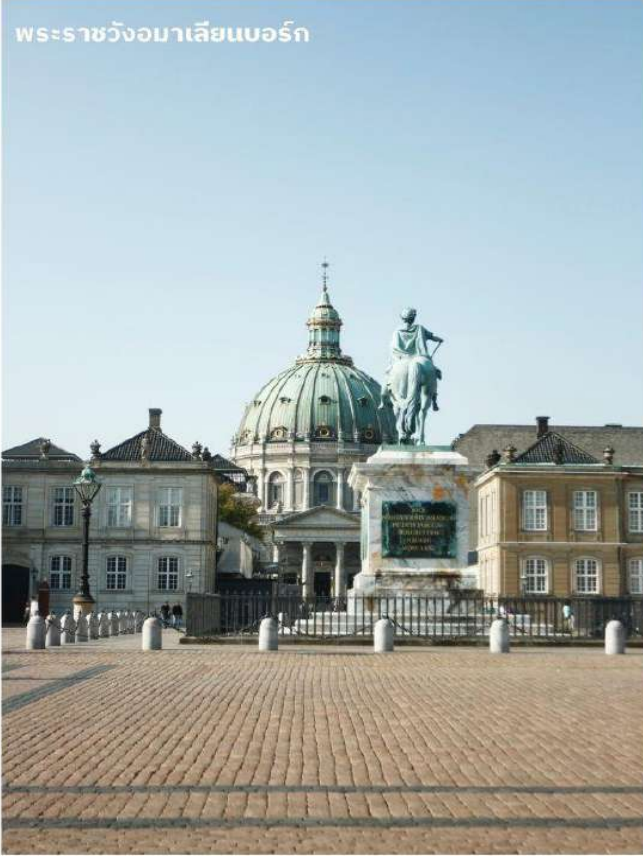
พระราชวังอมาเลียนบอร์ก