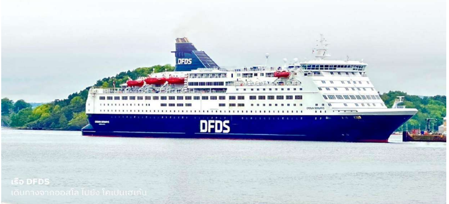
เรือ DFDS เดินทางจากออสโล ไปยัง โคเปนเฮเก้น