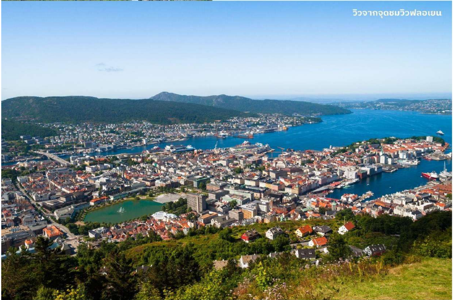
วิวจากจุดชมวิวฟลอยเอน

หลังจากนั้นนำท่านเดินทางสู่ ยอดเขาฟลอยเอน (Floyen) โดยรถรางไฟฟ้า ผ่านแมกไม้ทิวทัศน์สวยๆ งามๆ ตลอดทาง แม้จะเป็นฤดูหนาวแต่สำหรับเบอร์เก้นแล้วนี่คือเมืองที่มีอากาศไม่หนาวจัดเท่าเมืองอื่นๆ ของนอร์เวย์จากการที่มีแนวเทือกเขาล้อมกันกระแสน้ำอุ่นเชื่อมต่อกับทะเลเข้าสู่เมือง ชมวิวกันเพลินๆ ก่อนที่รถรางจะเข้าจอดที่สถานีบนยอดเขาในระดับความสูงเหนือระดับน้ำทะเล 320 เมตร ทำให้มองเห็นไกลไปถึงท่าเรือใหญ่ที่มีทั้งเรือรบและเรือสำราญหรู เห็นบ้านเรือนและผู้คน เห็นถึงความ เป็นเมืองท่องเที่ยวที่มีครบทุกรูปแบบจากวิวพาโนรามาที่ทำให้มองเห็นภาพความเป็นเบอร์เก้นได้ชัดเจนที่สุด