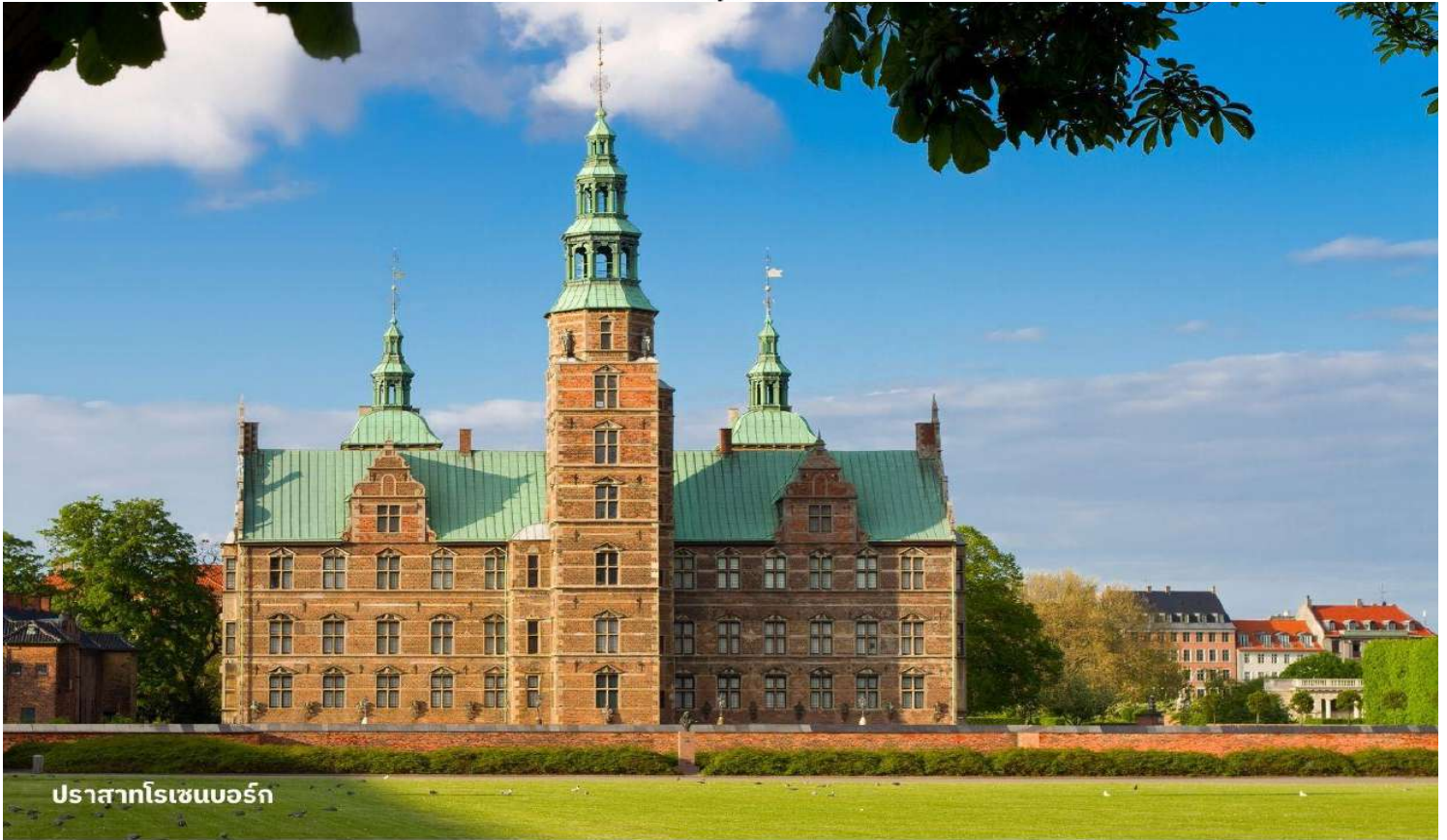
ปราสาทโรเซนบอร์ก