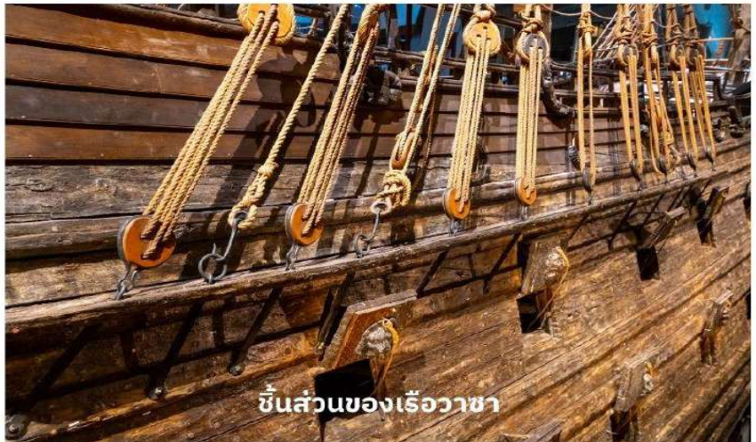
ชิ้นส่วนของเรือวาซา