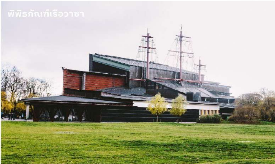
พิพิธภัณฑ์เรือวาซา

จากนั้นนำท่านเข้าชม พิพิธภัณฑ์เรือวาซา ซึ่งตั้งโชว์เรือรบโบราณที่กู้ขึ้นมาได้จากที่ใต้ทะเล และยังคงสภาพที่สมบูรณ์ จัดเป็นพิพิธภัณฑ์ที่มีชื่อเสียงที่สุดแห่งหนึ่งในสต็อกโฮล์ม เรือวาซานั้นสร้างขึ้นเมืองปี ค.ศ.1628 เพื่อให้เป็นเรือรบที่ใหญ่ที่สุด โดยบรรทุกปืนใหญ่ถึง 64 กระบอก แต่เพียงวันแรกก็ออกเดินทางได้ประมาณ 500 เมตร เรือก็จมลงสู่ใต้ทะเลลึก 35 เมตร และในศตวรรษที่ 20 เรือลำนี้ได้ถูกยกขึ้นมาจากใต้ทะเลโดยใช้เทคนิคพิเศษที่มีความทันสมัย และได้้นำเรือวาซาลำดังกล่าวมาจัดแสดงเป็นพิพิธภัณฑ์ ทุกท่านจะได้พบกับเรือ Vasa ขนาดใหญ่ และจะได้ชมโครงสร้างของเรือ, ประวัติของการสร้างและสถานการณ์ที่ทำให้เรือล่ม รวมถึงเรียนรู้เรื่องราวต่างๆ ที่เกี่ยวข้องกับ Vasa ได้อย่างลึกซึ้ง