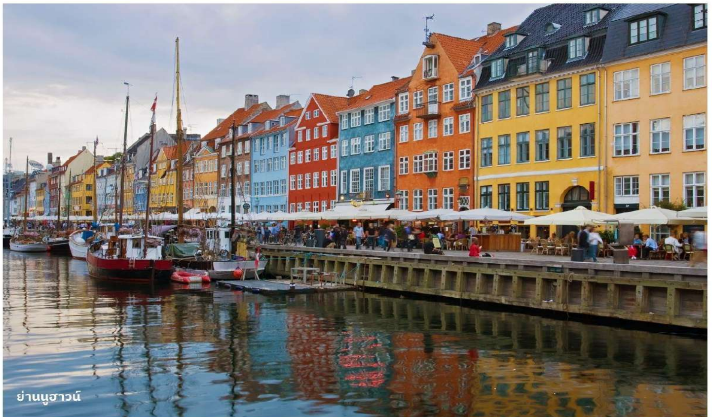
ย่านนูฮาวน์

ในช่วงฤดูร้อนนูฮาวน์เป็นที่นิยมสำหรับวัยรุ่นชาวเดนมาร์ก ที่นิยมมานั่งรับประทานอาหารและเครื่องดื่ม อิสระให้ท่านเดินเล่นถ่ายรูปเก็บความทรงจำตามอัธยาศัย ได้เวลาอันสมควรนำท่านสู่สนามบิน