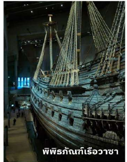
พิพิธภัณฑ์เรือวาซา