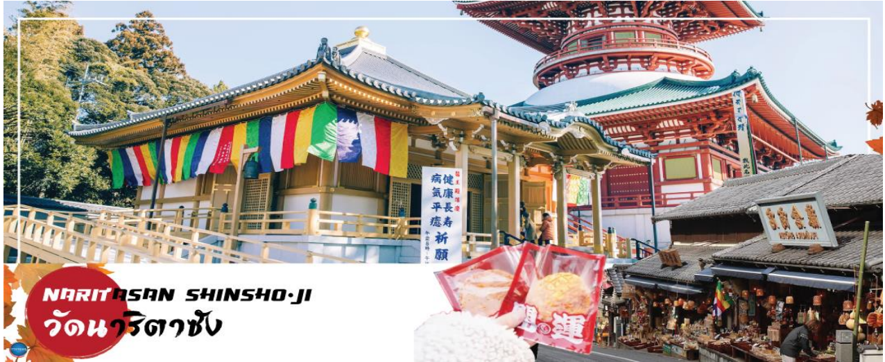
NARITASAN SHINSHO-JI วัดนาริตาชิน

02.30 น. เhierฟ้าสู่ เมืองนาริตะ ประเทศญี่ปุ่น โดยเที่ยวบินที่ XJ602 สายการบิน AIR ASIA X ใช้เครื่องบิน AIRBUS A330-300 จำนวน 377 ที่นั่ง จัดที่นั่งแบบ 3-3-3 (น้ำหนักกระเป๋า 20 กก./ท่าน หากต้องการซื้อน้ำหนักเพิ่ม ต้องเสียค่าใช้จ่าย)