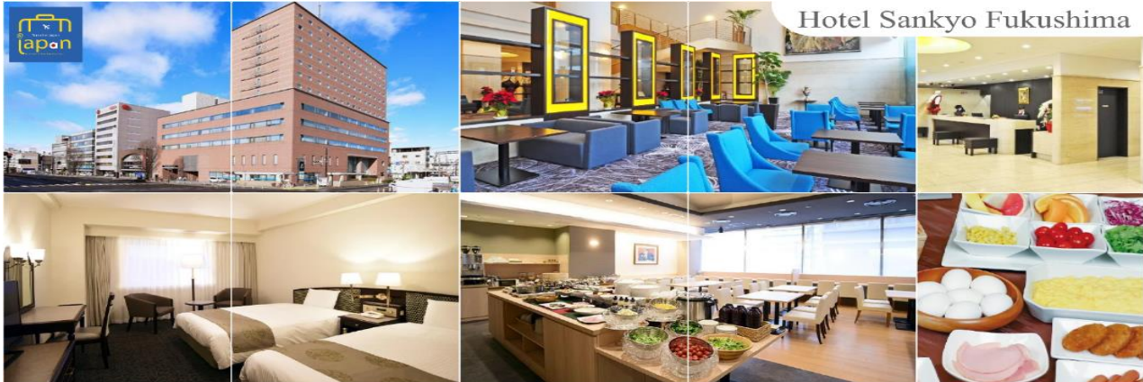
Hotel Sankyo Fukushima

พักที่ HOTEL SANKYO FUKUSHIMA หรือเทียบเท่าระดับเดียวกัน