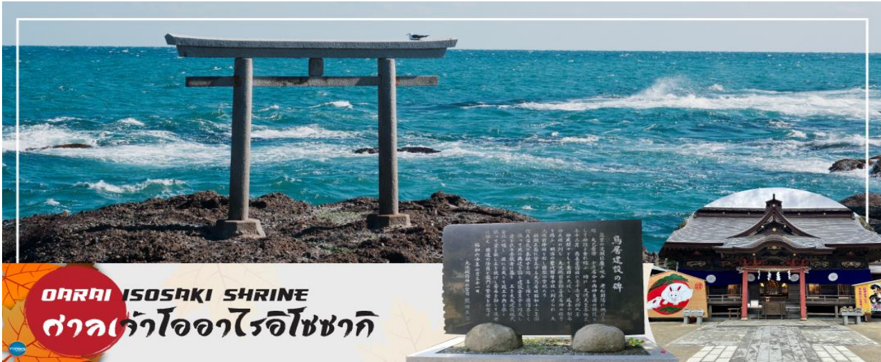
OARAI ISOSAKI SHRINE ศาลเจ้าโออาริอิโซซากิ

เดินทางสู่ ศาลเจ้าโออาริอิโซซากิ (Oarai Isosaki Shrine) ศาลเจ้าที่มีประวัติศาสตร์ยาวนาน ตั้งอยู่บนเนินเขาหันหน้าสู่มหาสมุทรแปซิฟิก เป็นหนึ่งในเสาโทริอิขนาดใหญ่ที่มีชื่อเสียงในภูมิภาคคันโต ถูกเลือกให้เป็นทรัพย์สินทางวัฒนธรรมแห่งจังหวัด และได้รับความเชื่อถือมาอย่างยาวนานในฐานะเทพเจ้าผู้ให้ความคุ้มครองการคมนาคมทางทะเล และความสงบสุขภายในครอบครัว นำท่านรับพลังงานบวก ณ เสาโทริอิแห่งคามิอิโซะ (Kamiiso no Torii) โทริอิสี่เสาที่นิ่งสงบ บนโขดหินท่ามกลางฟองคลื่นสีขาวที่สาดกระเซ็น ซึ่งเป็นที่ประดิษฐานของเทพเจ้าโอนามิจิโนะมิโคโตะ และเทพเจ้าสุคะนะฮิโคเนะโนะมิโคโตะ สร้างขึ้นตั้งแต่ 29 ธันวาคม ค.ศ.856 รวมทั้งยังเป็นจุดถ่ายรูปพระอาทิตย์ขึ้นที่มีชื่อเสียง มีนักท่องเที่ยวมากมายมาเฝ้าคอยเพื่อเก็บภาพช่วงเวลาที่แสงตะวันสาดส่องขึ้นสู่ขอบฟ้า