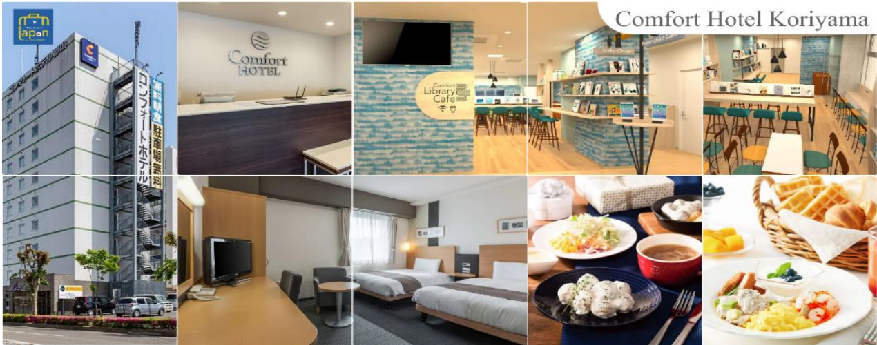
Comfort Hotel Koriyama

พักที่ COMFORT HOTEL KORIYAMA หรือระดับเดียวกัน