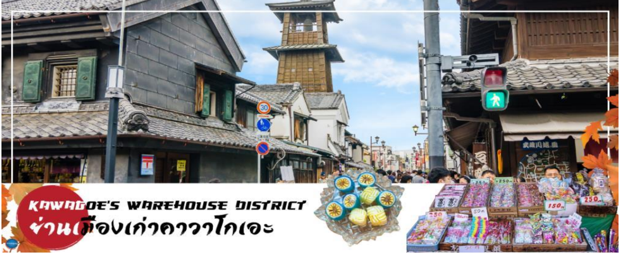
KAWAGOE'S WAREHOUSE DISTRICT ย่านเมืองเก่าคาวาโกเอะ

เที่ยง รับประทานอาหารกลางวัน ณ ภัตตาคาร (3)