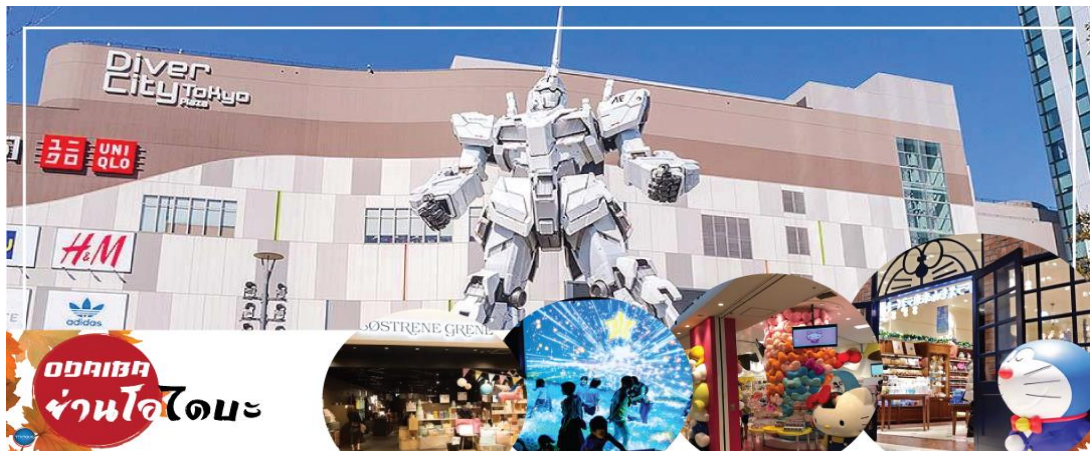
ออดิบะ ย่านโอไดบะ

นำท่านเดินทางสู่ ย่านโอไดบะ (Odaiba) (ใช้เวลาเดินทางโดยประมาณ 1.20 ชั่วโมง) เมืองคือเกาะที่สร้างขึ้นไว้เป็นแหล่งช้อปปิ้ง และแหล่งบันเทิงต่างๆ ในอ่าวโตเกียว ได้รับการปรับปรุงให้มีชื่อเสียงและเป็นที่นิยมในช่วงหลังของปี 1990 นอกจากมีสถาปัตยกรรมที่สวยงามตั้งอยู่มากมายแล้ว แต่ก็ยังคงความเป็นธรรมชาติไว้ด้วยความอุดมสมบูรณ์ของพื้นที่สีเขียว ไดเวอร์ซิตี โตเกียว พลาซ่า (Diver City Tokyo Plaza) เป็นห้างดังอีกห้างหนึ่ง ที่อยู่บนเกาะ โอไดบะ จุดเด่นของห้างนี้ก็คือหุ่นยนต์กันดั้ม ขนาดเท่าของจริง ซึ่งมีขนาดใหญ่มาก ในบริเวณห้าง อิสระช้อปปิ้งตามอัธยาศัย