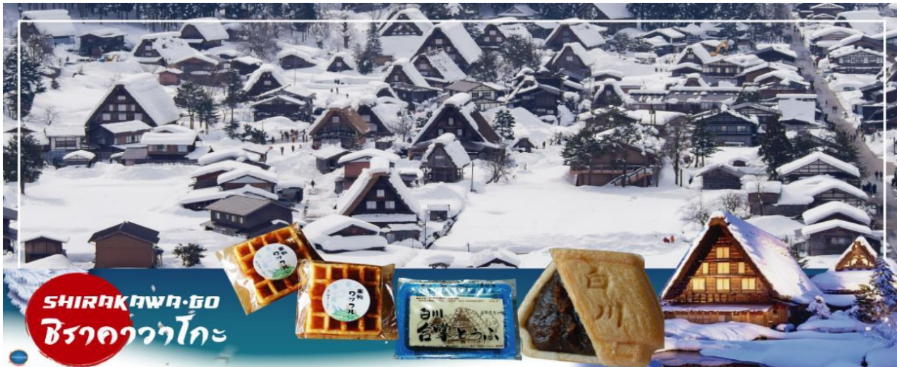
SHIRAKAWA-GO ชิราคาวาโกะ