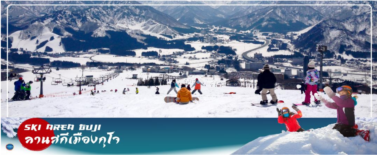
SKI AREA GUJO ลานสกีเมืองคุโจ