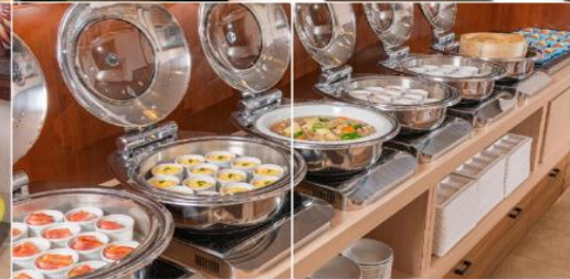
Alpico Plaza Hotel