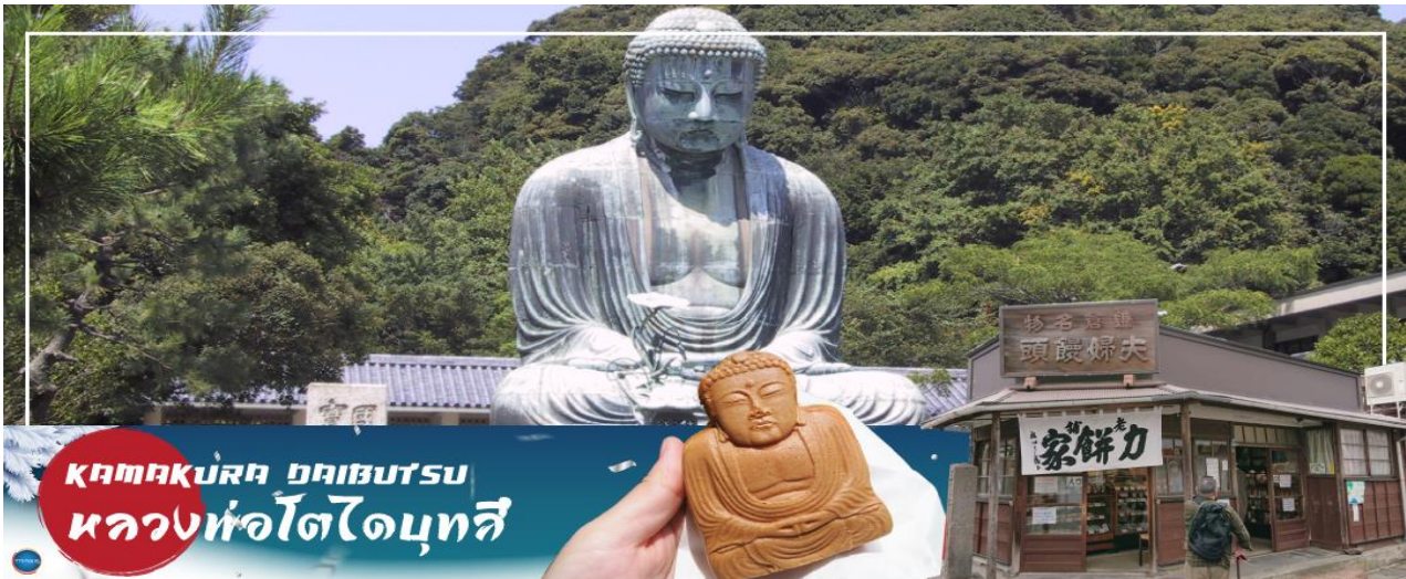
KAMAKURA OBIBUTSU หลวงหัวโอบุทสึ

08.00 น. เดินทางถึง ท่าอากาศยานนานาชาตินาริตะ ประเทศญี่ปุ่น นำท่านผ่านขั้นตอนการตรวจคนเข้าเมืองและศุลกากร เรียบร้อยแล้ว (เวลาที่ญี่ปุ่น เร็วกว่าเมืองไทย 2 ชั่วโมง กรุณาปรับนาฬิกาของท่านเพื่อความสะดวกในการนัดหมายเวลา) ***สำคัญมาก!! ประเทศญี่ปุ่นไม่อนุญาตให้นำอาหารสด จำพวก เนื้อสัตว์ พืช ผัก ผลไม้ เข้าประเทศ หากฝ่าฝืนมีโทษปรับและจับ