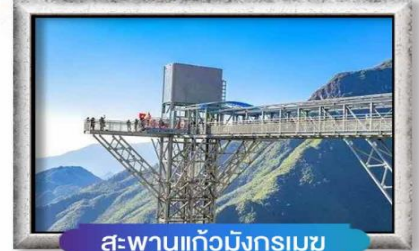
สะพานแก้วมิงกรมเซ