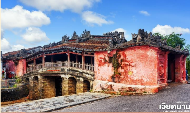
เวียดนาม

BT-DAD51_VZ_DEC 2024 - MAR 2025 DANANG HOIAN BANAHILLS (พักบานาฮิลล์)