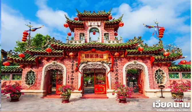
เวียดนาม