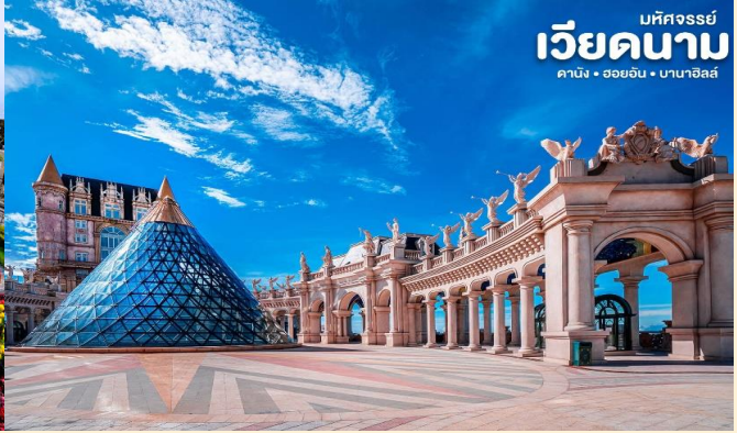
มหัทศจรรย์ เวียดนาม ดานัง • ฮอยอัน • บานาฮิลล์