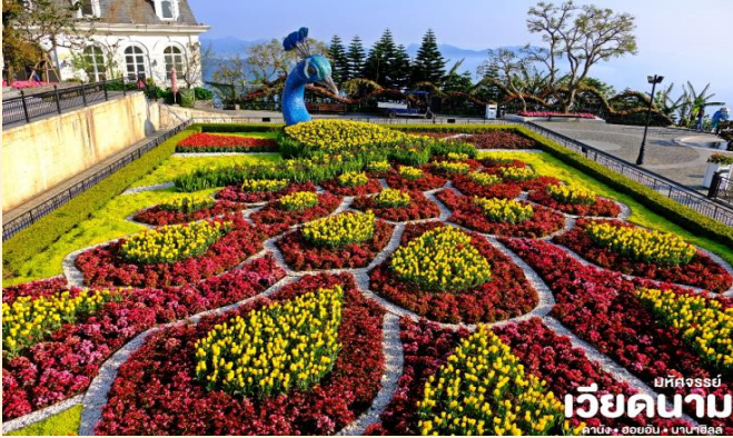
มหัทศจรรย์ เวียดนาม ดานัง • ฮอยอัน • บานาฮิลล์

BT-DAD092_VZ_DEC 2024 - MAR 2025 DANANG HOIAN BANAHILLS (พักบานาฮิลล์)