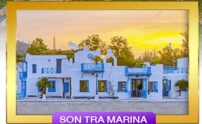
SON TRA MARINA