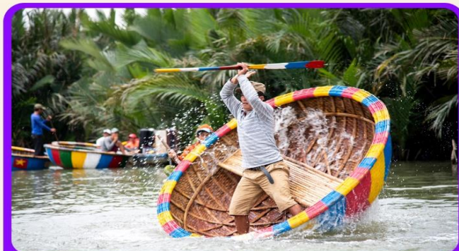
พิเศษ !!! นั่งเรือกระดัง UNSEEN เวียดนาม