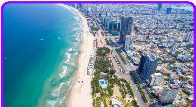
เช็किन ชายหาดหมีคว เป็นชายหาดที่สวยงามที่สุดในเมืองดานัง