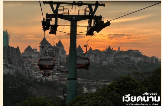
เบสิคจอร์จีย์ เวียดนาม ดานัง • ฮอยอัน • บานาฮิลล์

นั่งกระเช้าขึ้นสู่บานาฮิลล์ กระเช้าแห่งบานาฮิลล์ นี้ได้รับการบันทึกสถิติโลกโดยWorld Record ว่า เป็นกระเช้าไฟฟ้าที่ยาวที่สุด ประเภท Non Stop โดยไม่หยุดแวะมีความยาวทั้งสิ้น 5,042 เมตร และเป็นกระเช้าที่สูงที่สุด 1,294 เมตร นักท่องเที่ยวจะได้สัมผัสสลุยเมฆหมอกและบางจุด มีเมฆลอยต่ำกว่ากระเช้าพร้อมอากาศบริสุทธิ์อัน สดชื่นจนทำให้ท่านอาจลืมนึกไปเสียด้วยซ้ำว่าที่นี่ไม่ใช่ยุโรปเพราะอากาศที่หนาวเย็นเฉลี่ยตลอดทั้งปี ประมาณ 10 องศาเท่านั้น