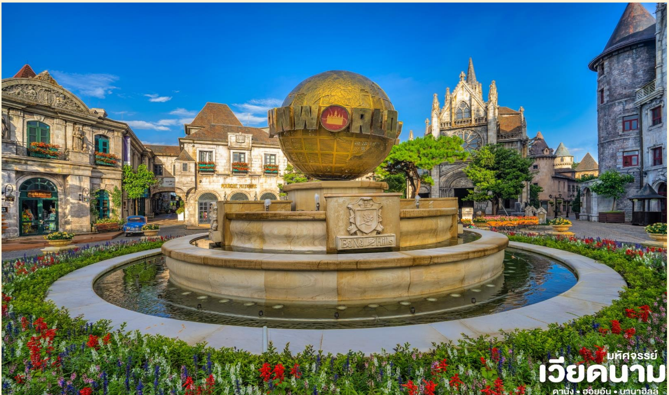
เบสิคจอร์จีย์ เวียดนาม ดานัง • ฮอยอัน • บานาฮิลล์