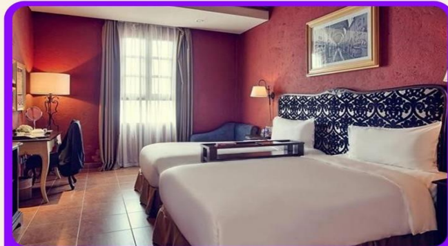
พักบนบานาฮิลล์ 1 คืน