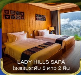
LADY HILLS SAPA โรงแรมระดับ 5 ดาว 2 คืน