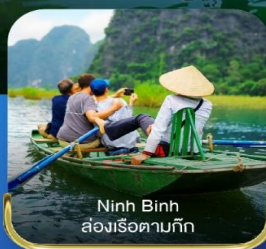
Ninh Binh ส่องเรือตามถ้ำ