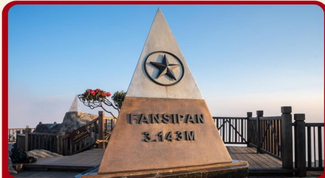
นั่งกระเช้าสู่อยอดเขาฟานซิปัน