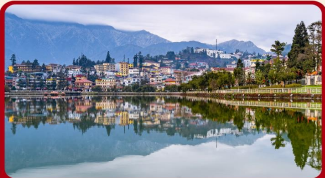
ทะเลสาบซาปา ทะเลสาบกลางเมืองซาปา