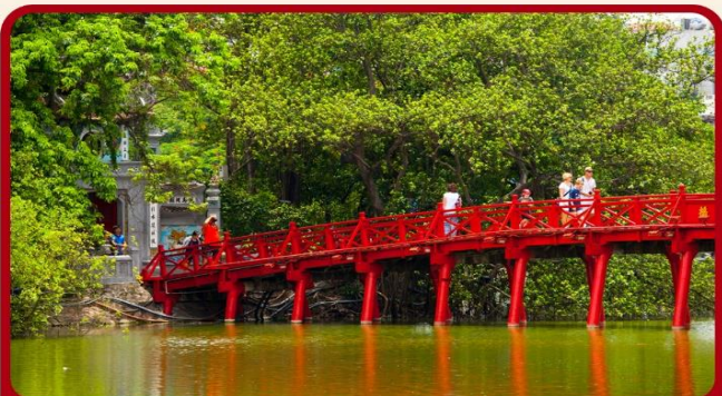
ชมสะพานแสงอาทิตย์ และ ทะเลสาบคินดาบ ทะเลสาบใจกลางเมืองฮานอย