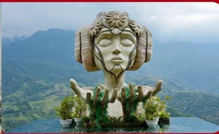
เชคอิน โมอาน่า (Moana Sapa Cafe)