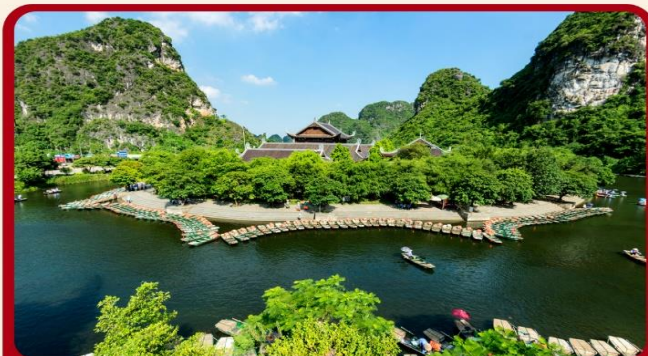
ล่องเรือจางอาน ชมวิวทิวทัศน์แห่งเวียดนาม