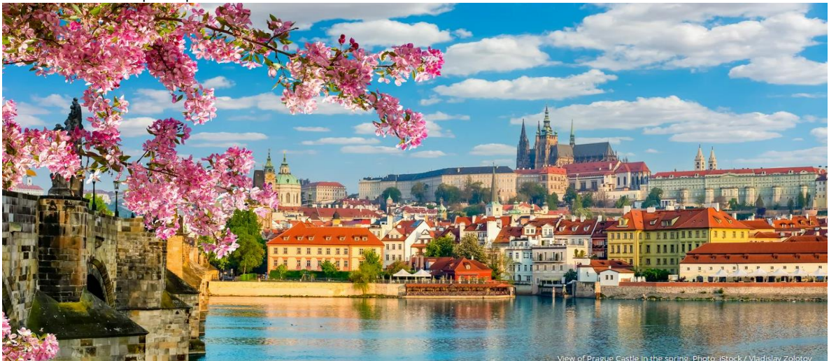
View of Prague Castle in the spring.

เที่ยง ป้าย รับประทานอาหารกลางวัน ณ ภัตตาคารอาหารพื้นเมือง ออกเดินทางสู่ กรุงปราก (PRAGUE) เมืองหลวงของสาธารณรัฐเช็ก ความโดดเด่นและความเจียบสงบของเมืองเก่าแก่ เมื่อ ค.ศ. 1992 องค์การยูเนสโกได้ประกาศให้ปราก เป็นมรดกโลก มีแม่น้ำวัลตาวา (VLTAVA) ไหลผ่านกรุงปรากจึงมีสะพานที่ทอดข้ามแม่น้ำวัลตาวาอยู่หลายแห่งเป็นจุดหมายในการท่องเที่ยวที่ได้รับคามนิยมมากที่สุดไนยุโรป