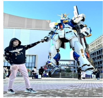
หุ่นกันดั้ม ชื่อ RX93 FF Nu Gundam

เดินทางต่อไปยัง ร้านค้า DUTY FREE ให้ท่านได้ช้อปปิ้งสินค้าปลอดภาษีที่มีคุณภาพ อาทิ เครื่องสำอาง โฟมล้างหน้า(แนะนำ) อาหารเสริม ขนม เครื่องใช้ต่างๆ ฯลฯ ...จากนั้นแวะ แซะรูปกับหุ่นกันดั้มยักษ์ ณ ห้าง LaLaport (หากมีเวลาพอ) มีขนาดใหญ่กว่า Unicorn Gundam ที่โตเกียวและใหญ่กว่า RX93 FF Gundam ที่ Gundam Factory Yokohama เรียกได้ว่าเป็นแลนด์มาร์คสำคัญของเมืองฟูกุโอกะในปัจจุบัน ...จากนั้นอิสระให้ท่านช้อปปิ้ง ย่านเทนจิน (Tenjin) หรือ ย่านฮาคาตะ (Hakata) เป็นย่านช้อปปิ้งขนาดใหญ่ใจกลางเมือง รวบรวมแหล่งบันเทิง อย่างครบครัน ไม่ว่าจะเป็นตึกต้นไม้ ร้านค้าที่น่าสนใจ และบรรยากาศสุดคลาสสิก