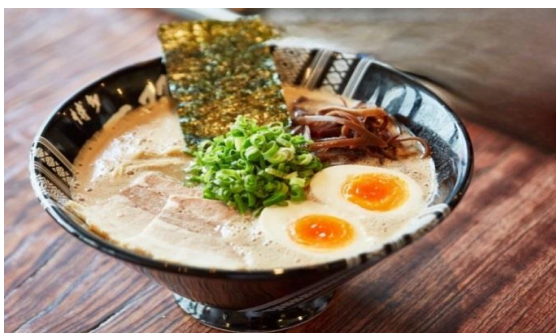
ฮาคาตะราเมง (Hakata Ramen)