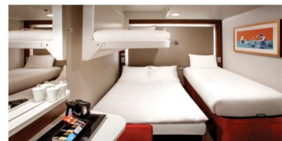
พัก 3-4 ท่าน