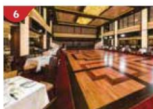
Dream Dining Room Savour a wide variety of Asian and international cuisine.