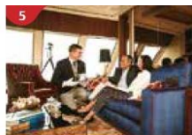
The Palace Indulge in European-style butler service and exclusive facilities.