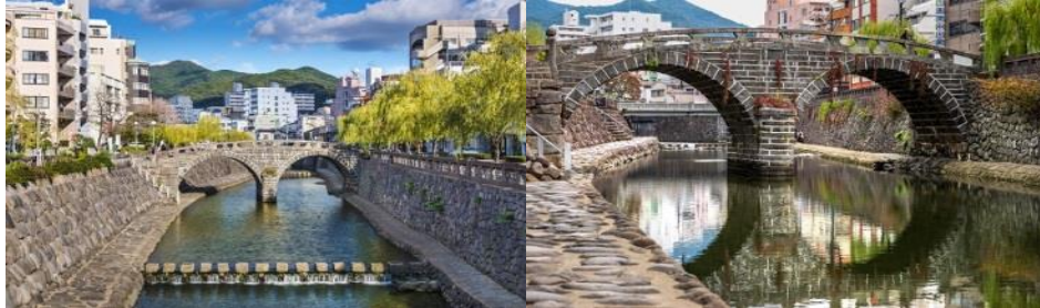
สะพานเมกานะบาชิ (Meganebashi Bridge)

ท่านสามารถลงไปเที่ยวอิสระตามอัธยาศัย หรือ ซื้อทัวร์เสริมของเรือที่ให้บริการอยู่ได้ ควรซื้อทัวร์เสริมของทางเรือก่อนจะถึงจุดหมายที่ท่านต้องการ 1 วันเดินทาง