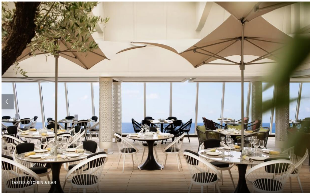
TASTES KITCHEN & BAR