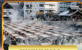
ชมยูบาทาเกะ