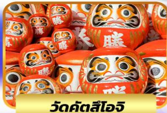
วัดคัตสึโงจิ