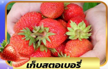
เก็บสตอเบอร์รี่