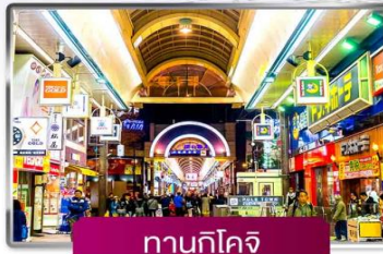
ทานุกิโจจิ