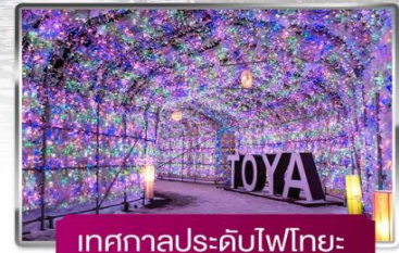
เทศกาลประดับไฟไทยะ