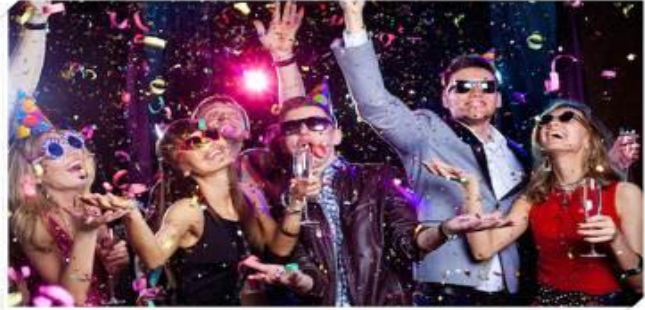
ENJOY THE NIGHT OF FANTASTIC PERFORMANCE