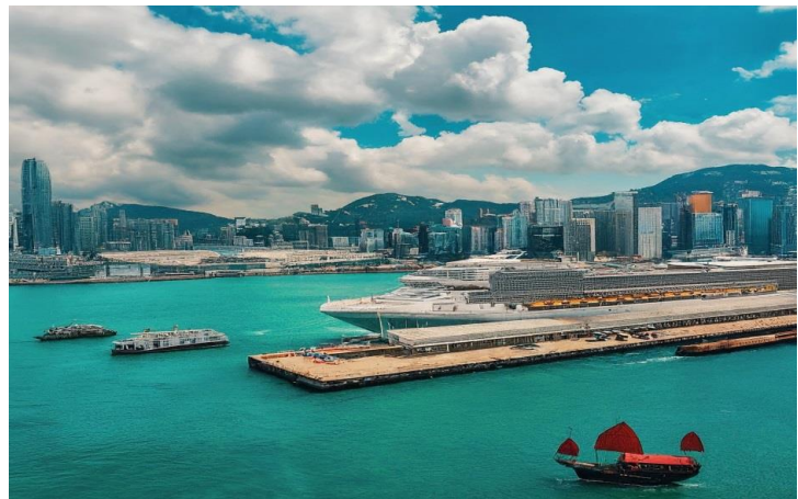
Spectrum Of The Sesa – QQCRHKG-RCI032 – ( HONG KONG 5D4N ) – (CRUISE ONLY)

เพื่อทำการเช็คอินก่อนอย่างน้อย 3 ชั่วโมง ก่อนเรือออก จากสนามบินนานาชาติ เช็ก สัมภาระ เดินทางโดย Taxi มาถึงท่าเรือ ได้ทันทีใช้เวลาประมาณ 1ชม