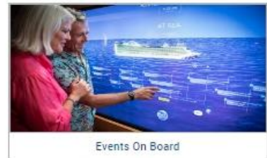
Events On Board