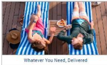
Whatever You Need, Delivered