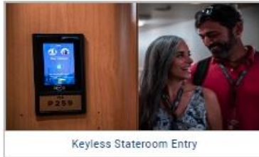
Keyless Stateroom Entry