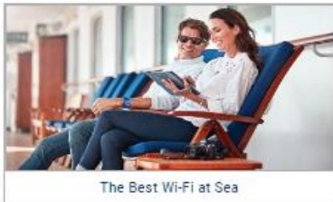
The Best Wi-Fi at Sea