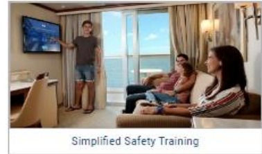
Simplified Safety Training