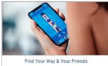
Find Your Way & Your Friends