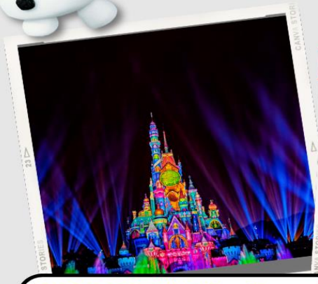
“MOMENTOUS” มหึศจรรยแสงสีแห่งราตรี