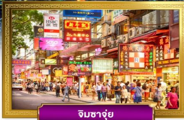
จิมซาจุ่ย