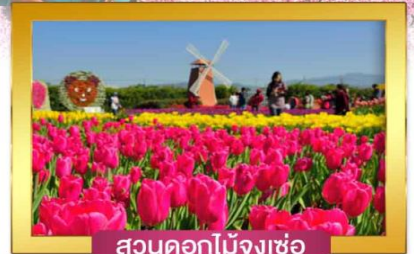
สวนดอกไม้จิงเซอ