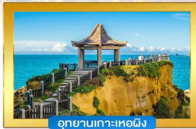
อุทยานเกาะเหอผิง