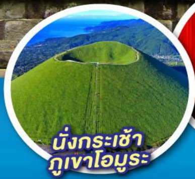
นั่งกระเช้า กุเอาโอมุโระ

จุดชมวิวกุเอาไฟฟูจิ ป่าสนมิโฮะ โนะมัตสึบาระ