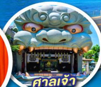
ศาลเจ้า นิมบะยาซากะ