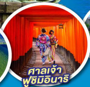
ศาลเจ้า ฟุชิมิอินาริ