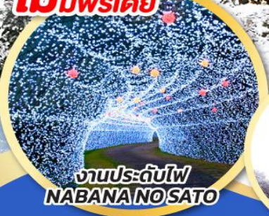
งานประดับไฟ NABANA NO SATO