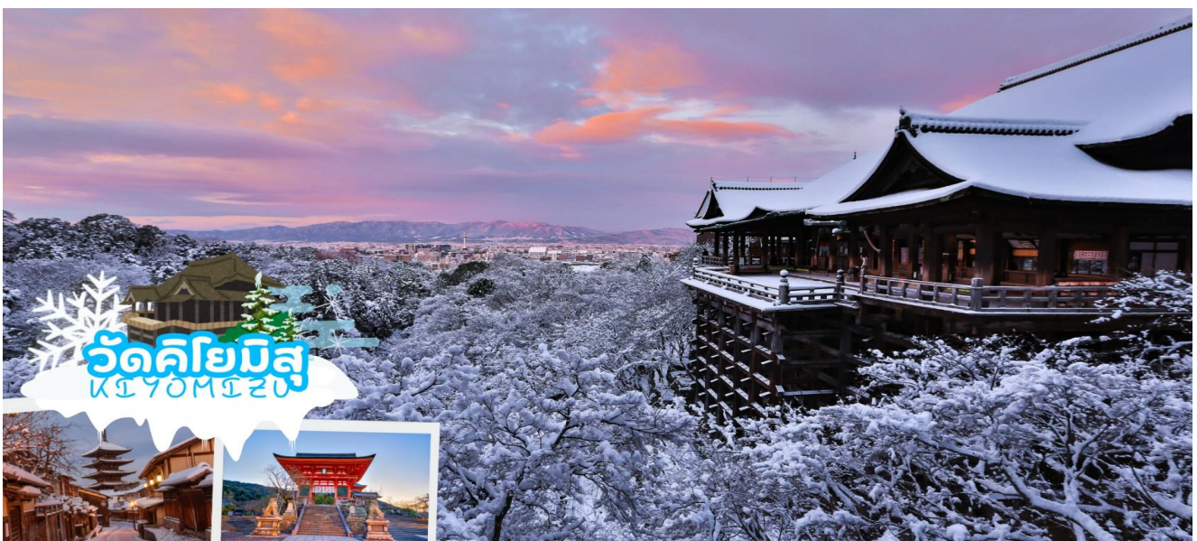
GO2KIX-XJ010 – OSAKA SHIRAKAWAGO SKI WINTER 6D 4N BY XJ

เดินทางสู่ เมืองเกียวโต (Kyoto) ซึ่งในอดีตเคยเป็นเมืองหลวงของประเทศญี่ปุ่น และยาวนานที่สุด คือตั้งแต่ปี ค.ศ. 794 จนถึง 1868 รวม ๆ 1,100 ปีเลยทีเดียว เมืองเกียวโตจึงเป็นเมืองที่มีสถานที่สำคัญ ๆ ที่เต็มไปด้วยประวัติศาสตร์และวัฒนธรรมดั้งเดิมของญี่ปุ่น