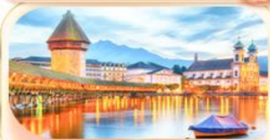
สะพานไมซ์าเปล