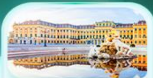
พระราชวังชินบรุนน์