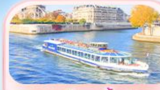
คลองเรือแม่น้ำเซน