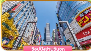
ช้อปปิ้งย่านชินจูกุ