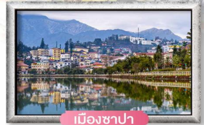
เมืองซาปา