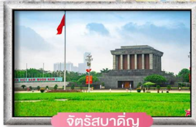
จัตุรัสบาติญ