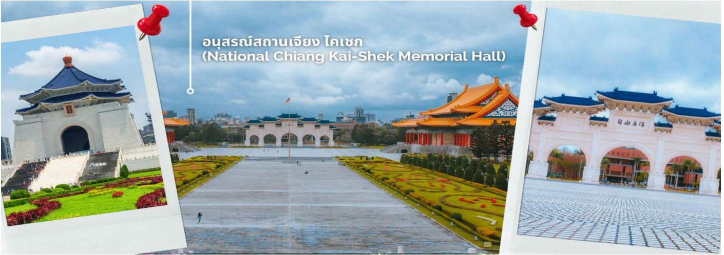
อนุสรณ์สถานเจียง ไคเชก (National Chiang Kai-Shek Memorial Hall)

ถูกสร้างขึ้นตามแบบสถาปัตยกรรมจีนโบราณ บนโด่งสี่ด้านถูกสร้างด้วยหินอ่อนสีขาวเป็นชั้นตามแบบ พีระมิดอียิปต์ หลังคาสีน้ำเงิน รวมทั้งยังมีสวนดอกไม้สีแดง ที่เป็นการแสดงออกทางสัญลักษณ์ให้เห็นถึง อิสรภาพ ความเท่าเทียม และความเป็นหนึ่งเดียวกัน ตามสีของธงชาติไต้หวัน