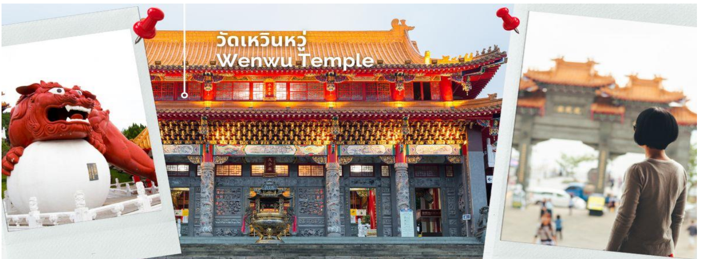
วัดเหวินหวู่ Wenwu Temple

จากนั้นนำท่านสักการะเทพเจ้ากวนอู ณ วัดเหวินหวู่ หรือ วัดกวนอู วัดแห่งนี้เป็นวัดใหม่ที่ทางการญี่ปุ่นสร้างขึ้นหลังจากทำการสร้างเชื่อมทำให้วัดเก่า 2 วัด จมอยู่ใต้เขื่อน การออกแบบของวัดเหวินหวู่โครงสร้างคล้ายกับพระราชวังกู้กง ของประเทศจีน ภายในวิหารประดิษฐานเทพเจ้ากวนอู เทพเจ้าแห่งความซื่อสัตย์และคุณธรรม การขอพรจากองค์เทพกวนอู ณ วัดเหวินหวู่ ที่วัดมีรูปปั้นของซงจ้อและเทพกวนอู (เทพเจ้าแห่งปัญญา และเทพเจ้าแห่งความซื่อสัตย์) ซึ่งชาวไต้หวันเชื่อกันว่า หากได้บูชาเทพเจ้ากวนอู จะได้ประสบความสำเร็จในหน้าที่การงาน มีแต่คนจงรักภักดี หรือหากวางแผนสิ่งใด ก็จะสามารถประสบความสำเร็จตามปรารถนา จึงทำให้ได้รับความนิยมจากชาวไต้หวัน ที่มาสักการะขอพรองค์เทพในวัดแห่งนี้