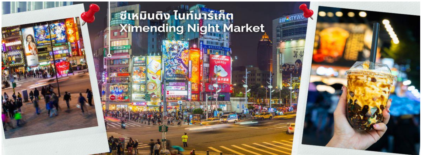
ซีเหมินติง ไทท์มาร์เก็ต Ximending Night Market

ค่า อิสระอาหารค่ำ เพื่อให้ทุกท่านเต็มกับการช้อปปิ้งซึ่งไกด์จะแนะนำร้านอาหารร้านเด็ดร้านอร่อยให้