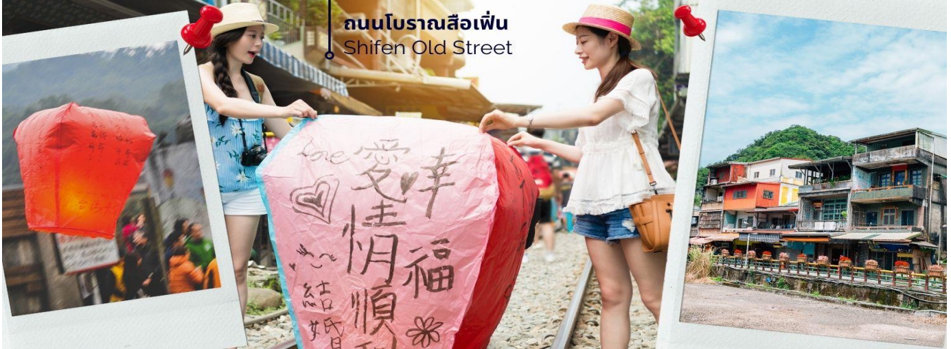
ถนนโบราณสี่เฟิน Shifen Old Street

จากนั้นนำท่านไป ถนนโบราณสี่เฟิน (Shifen Old Street) เป็นชุมชนเล็กๆ ริมหางรถไฟสายเก่าของสายรถไฟผิงซี (Ping xi Line) ถนนแห่งนี้เป็นชุมชนเก่าแก่ที่เมื่อก่อนเป็นเส้นทางลำเลียงถ่านหินสมัยที่ญี่ปุ่นยึดครองไต้หวัน นักท่องเที่ยวนิยมมาปล่อยโคมลอยกระดาษ เมื่อซื้อโคมไฟก็มีการเขียนความปรารถนาที่จะอธิษฐาน และปล่อยขึ้นท้องฟ้า และสนุกกับการเดินเล่นไปตามรางรถไฟ มีร้านอาหารและโปสการ์ดให้เลือกซื้อ ร้านขายงานฝีมือผลิตภัณฑ์โคมไฟ (รวมค่าบริการปล่อยโคมลอย 1 โคม / 4 ท่าน)