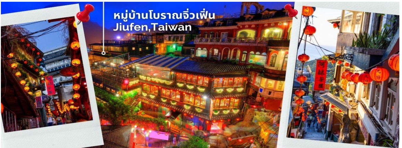
หมู่บ้านโบราณจิวเฟิน Jiufen, Taiwan

นำทุกท่านเดินทางไปสู่สัมผัสบรรยากาศ หมู่บ้านโบราณจิวเฟิน ที่ตั้งอยู่บริเวณไหล่เขาใน เมืองจีหลง หมู่บ้านจิวเฟิน เคยเป็นแหล่งเหมืองทองที่มีชื่อเสียงตั้งแต่สมัยโบราณ ปัจจุบันเป็นสถานที่ท่องเที่ยวที่สำคัญแห่งหนึ่ง เพราะเป็นถนนคนเดินเก่าแก่ที่มีชื่อเสียงที่สุดในไต้หวัน ให้ท่านได้เพลิดเพลินบรรยากาศแบบดั้งเดิมของร้านค้า ร้านอาหารของชาวไต้หวันในอดีตและยังสามารถชื่นชมวิวทิวทัศน์รวมทั้งเลือกชิมและซื้อชาจากร้านค้าที่มีอยู่มากมายอีกด้วย *เสาร์-อาทิตย์ ต้องเปลี่ยนเป็นรถสาธารณะ