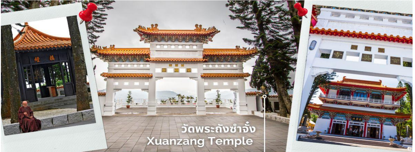
วัดพระถังซำจั๋ง Xuanzang Temple