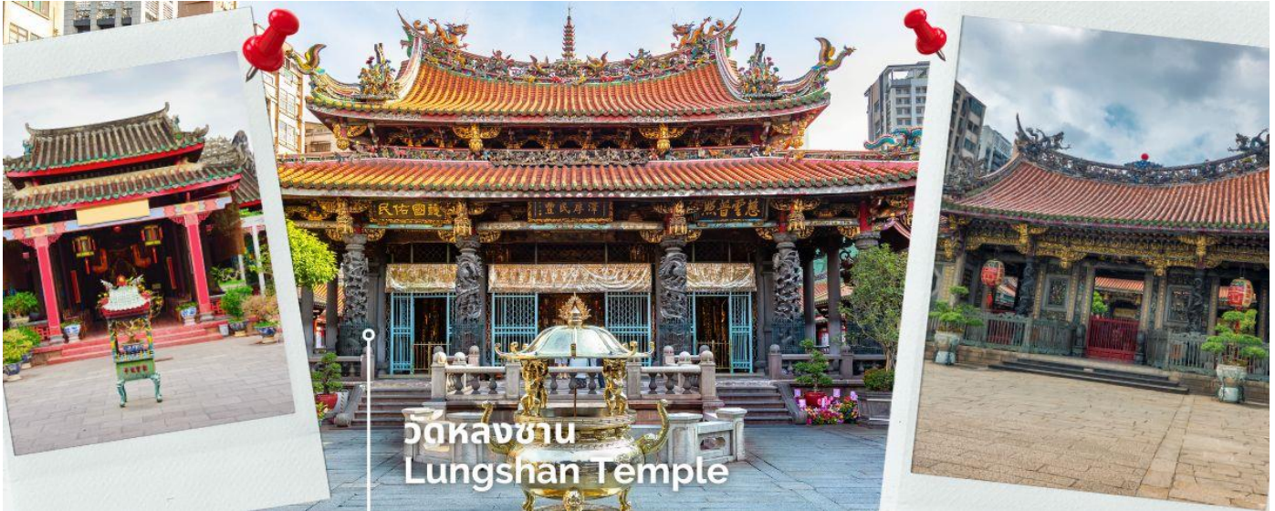
วัดหลงซาน Lungshan Temple

ยังมีเทพเจ้าองค์อื่นๆตามความเชื่อของชาวจีนอีกมากกว่า 100 องค์ด้านในมาจากทั้งศาสนาพุทธ เต๋า และขงจื้อ เช่น เจ้าแม่ทับทิม ที่เกี่ยวข้องกับการเดินทาง,เทพเจ้ากวนอู เรื่องความซื่อสัตย์และหน้าที่การงาน และเทพเยวี่เหล่า หรือ ผู้เฒ่าจันทรา ที่เชื่อกันว่าเป็นเทพผู้ผูกต้ายแดงให้สมหวังด้านความรัก