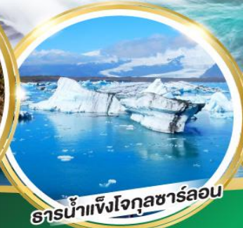
ธารน้ำแข็งโจกุลซาร์ลอน