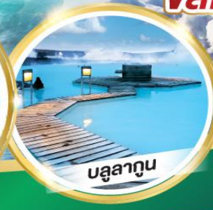
บรูลาทูน