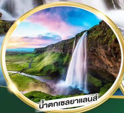
น้ำตกเซลยาแลนส์