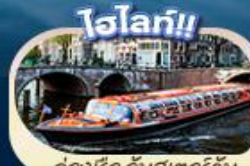
ล่องเรือ อัมสเตอร์ดัม

“ตำนานเด็กยีนจี สัญลักษณ์แห่งกรุงบรัสเซลส์ แมนเนเกน พิส มหาวิหารโคโลญ” สะพานไฮอินซอลลิรัน ล่องเรือชมหมู่บ้านที่โรรัน กังหันลมซานส์คคัส คลองอัมสเตอร์ดัม บรัสเซลส์ อะโตเมียม จัตุรัสรูจส์ โฮไอเฟล จัตุรัสคองคอร์ด พิพิธภัณฑลัฟร์ ล่องเรือแม่น้ำเซน ซ็อบบิงแบบจุใจที่ห้างชั้นนำ