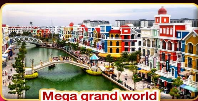
Mega grand world