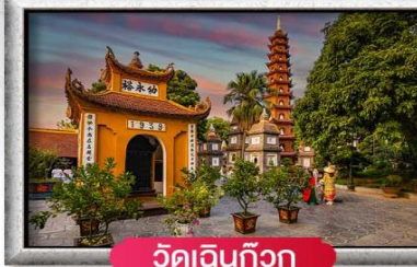
วัดเงินทิว๊ก