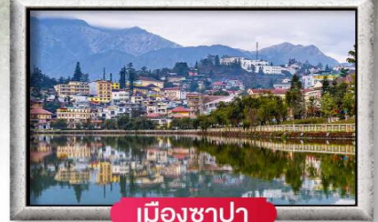
เมืองซาปา