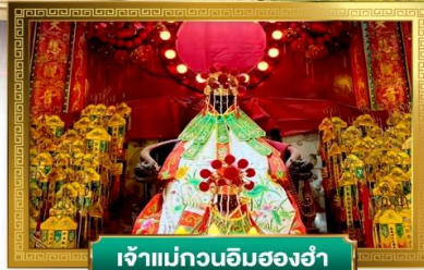
เจ้าแม่กวนอิมฮองฮ่า

✓ ขอพรเจ้าพ่อแซกซง หมุนกังหันเปลี่ยนชีวิต