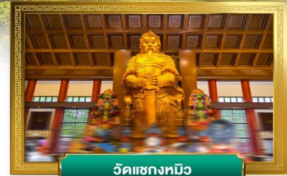
วัดแซกซงทมิว